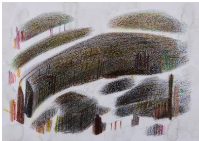
⑦ 山下扶規子 「夜の街」鉛筆・色鉛筆・画用紙 380×540mm