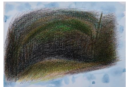
⑨ 山下扶規子 「霧の中」色鉛筆・画用紙 380×540mm