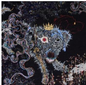
⑩ 祐加 Yucca 「カンナインフェルノ」岩絵の具・ 水干・ピグメント・墨・箔・綿布 910×910×15mm