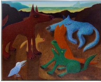
④ 笹谷太郎 「dawn」油彩・キャンバス 1300×1620×30mm