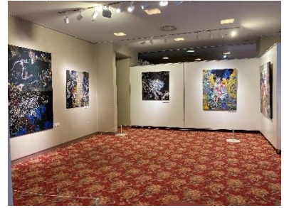
③ 会場写真(祐加 Yucca)