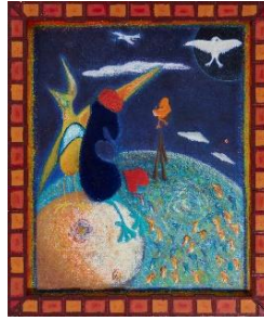
⑤ 笹谷太郎 「my self」油彩・キャンバス 727×606×20mm