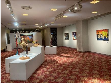
① 会場写真