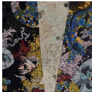
⑪ 祐加 Yucca 「飛ぶ夢を見る」岩絵の具・水干・ ピグメント・墨・箔・綿布 910×910×20mm