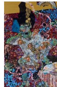
⑫ 祐加 Yucca 「夢の淵で待っている」岩絵の具・ 水干・ピグメント・墨・箔・綿布 1303×970×20mm