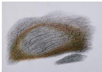
⑧ 山下扶規子 「夜の道」鉛筆・色鉛筆・画用紙 380×540mm