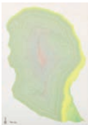
寝坊 Ken.Ta NEBO Ken.ta 「感覚の消去」