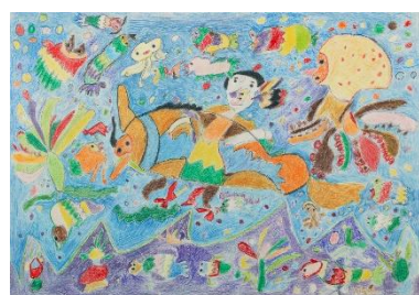
西尾 猛 「海の中」