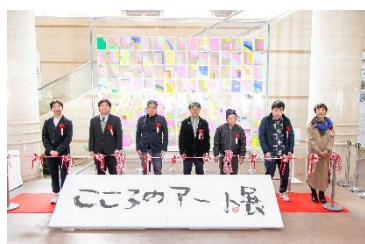
オープニングセレモニー

【昨年度の会場の様子】(下記の画像の掲載をご希望の際は、JPEG.データをお渡しいたします。)